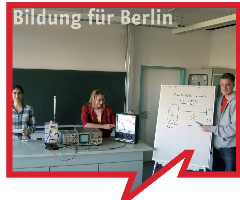
Die fünfte Prüfungskomponente im Abitur Eine Handreichung